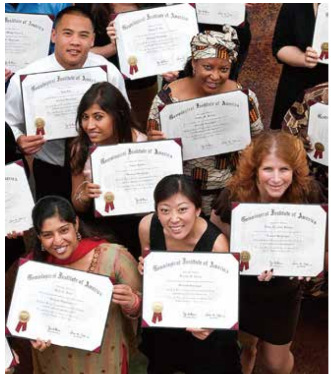
Earn your GIA credential and find your ideal career.

想要確認GIA畢業生之證書者，可以查閱GIA校友線上目錄(GIA Alumni Online Directory) 搜索結果將會呈現出那些選擇將其資訊顯示在網路上的畢業生。個人還可以通過在我們的網站 gia.edu/doc/GIA_Education_Verification-Request.pdf 上提交申請表以書面請求，來驗證畢業生的證書。