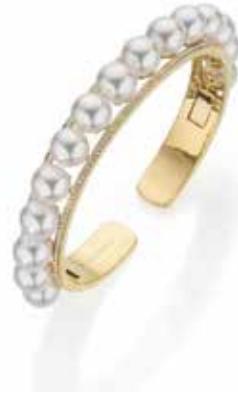
珍珠手鐲。總重1克拉鑽石、15顆8~8.5毫米養殖珍珠。